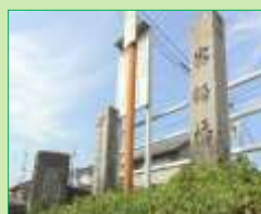
元町のささやき橋

出演 中須町さんさんサロン中之町の皆さんと 府中市社会福祉協議会音楽療法士の皆さん