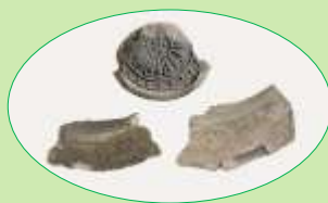
備後国府跡出土の軒瓦