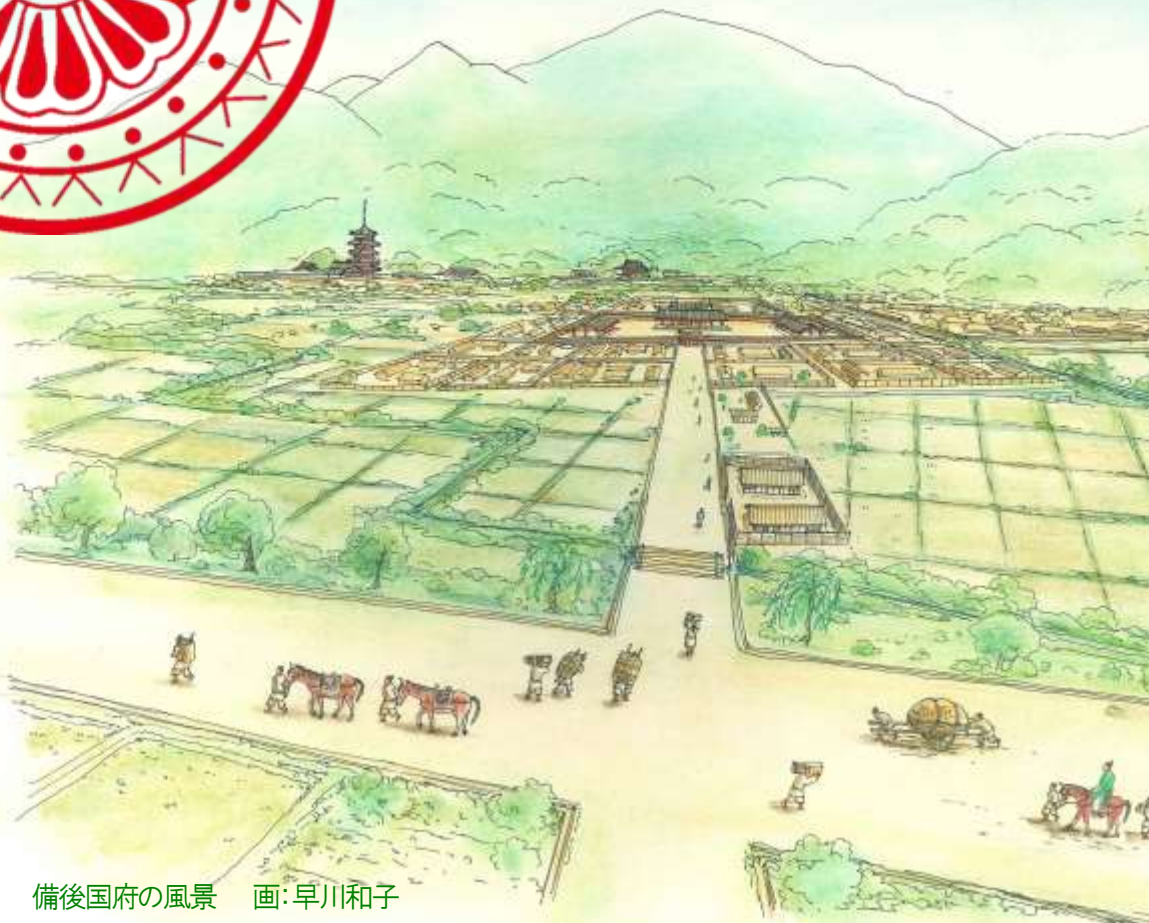
備後国府の風景 画:早川和子