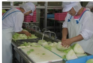
野菜の洗浄及び裁断