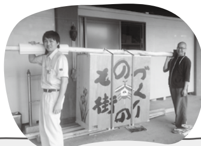
今年はこのスタイル!