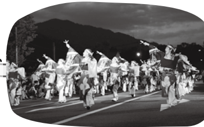
昨年優勝の神石踊娘隊きらきら星