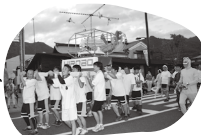
昨年優勝のヒロポー(株)