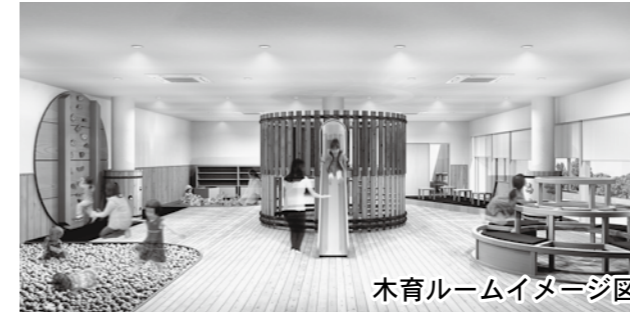
木育ルームイメージ図