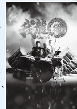
太鼓ユニット我龍

出演 22日(土)10時～…府中高校交響楽団、警察音楽隊、太鼓ユニット我龍、バトンスクール 23日(日)10時～…アンガールズ、ドラムパフォーマンズ、十五鼓乃会