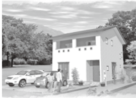
サラサホーム福山 (株)アペル