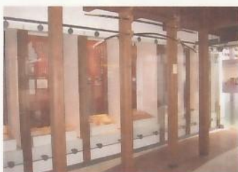
常設展示室 上下の歴史

昔懐かしい町並みの残る上下。その歴史の変遷や、今に伝わる歴史的遺産を紹介するコーナーです。普段は目にする機会の少ない貴重品も特別展示しています。