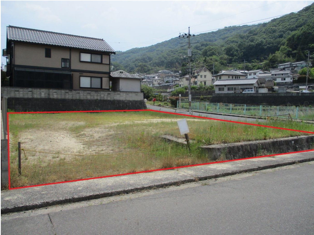
※朱線は土地売却の目安です。