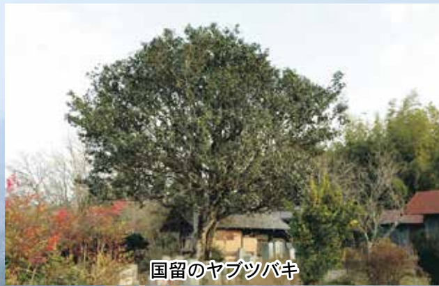
国留のヤブツバキ