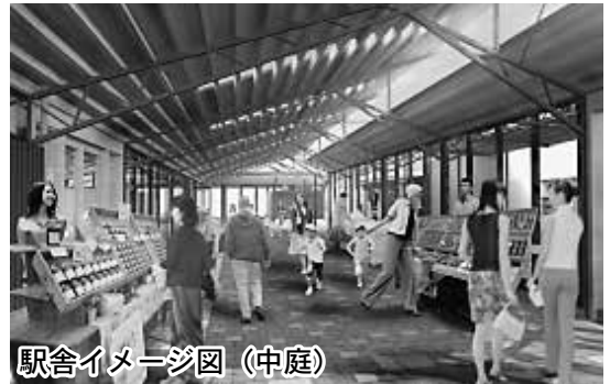
駅舎イメージ図(中庭)

◎農産物、特産品などの出荷者募集中 道の駅びんご府中の産直市、または売店への農産物や特産品などの出荷者を募集しています。