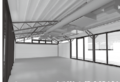
フリースペース(手前)と貸店舗(奥)