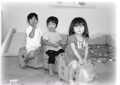
ままごと、積み木、 パズル、車、ドミノなど 全部木製のおもちゃです。

9月の木育あそびの日 8日(木)・22日(木)・29日(木) 10:00～16:30 ※時間内であれば、いつから来ても遊 べます。10月からも開催予定です。