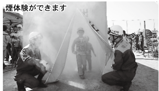
煙体験ができます

内容 警察・消防・自衛隊の救助機関、医師会・社会福祉協議会・児童委員・町内会の福祉機関、中電・NTTの関係機関などが、避難訓練や救助、消火など初動対応や応急対応、応急復旧の訓練を行います。