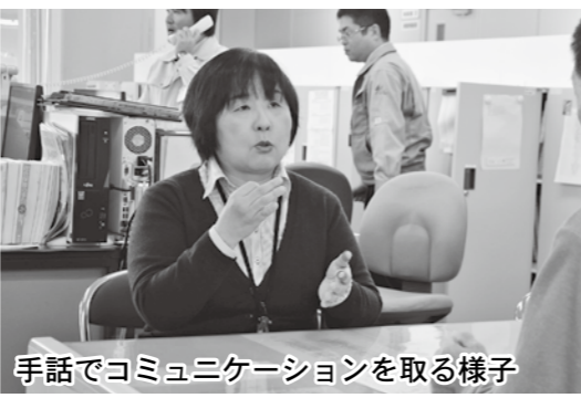
手話でコミュニケーションを取る様子

情報提供やコミュニケーションの手段である手話や音訳、要約筆記、点訳を学ぶ講座を開催しています。障害のある人の力になりませんか？興味のある人はお気軽にお問い合わせください。