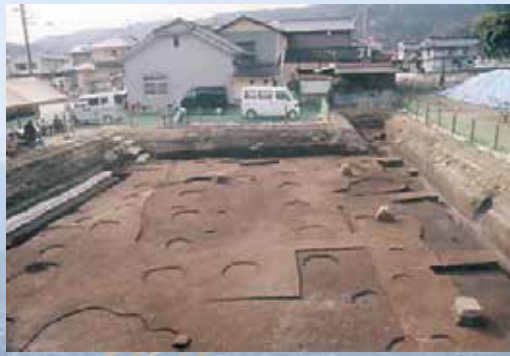
ツジ地区の調査で見つかった建物跡や区画溝