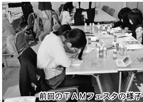
前回のTAMフェスタの様子

申し込み方法 生涯学習課または府中市生涯学習センターにある申込書で申し込んでください。