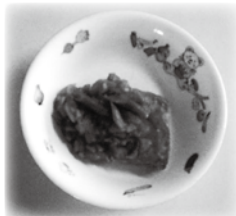
魚のトマトソースかけ

市の給食調理員が考案した添加物が少なく薄味の乳幼児向けレシピです。旬の食材で、手軽に作れる！保育所（園）の人気メニューなども紹介しています。府中市のホームページやちゅちゅにも掲載していますので、参考にしてみてください。