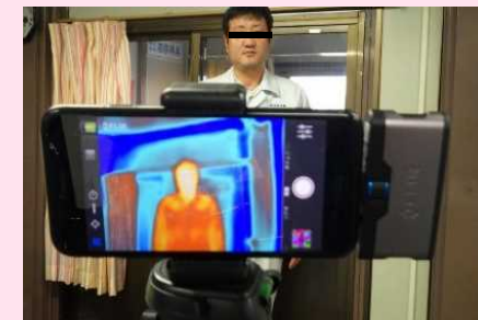
サーモグラフィカメラによる体温計測