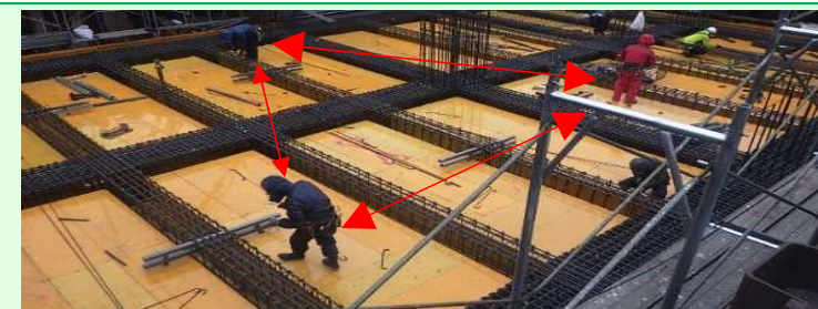
作業員の配置をブロック分けし密接した作業を回避