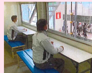
休憩室の窓の常時開放