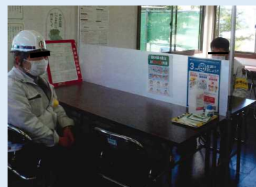
パーティションで密接を防止