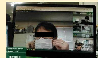
Web会議による打合せ