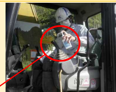
ハンドルやレバー等のアルコール消毒の徹底