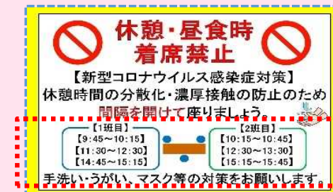
時間差による休憩時間の分散化