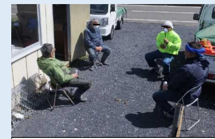
屋外で対人距離を確保して休憩