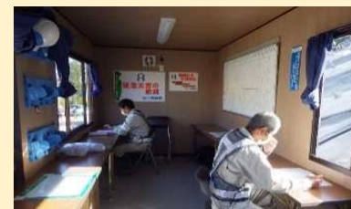
現場事務所での対人間隔の確保と換気