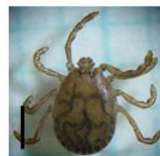
フタトゲチマダニ 成虫（オス）約2.3mm