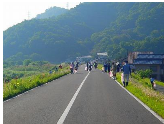
写真 2-2-1 左) 芦田川河川敷の景観 右) 芦田川一斉清掃