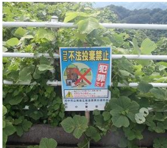
写真 2-2-2 左)グリーンパトロール隊の合同回収 右)不法投棄防止看板