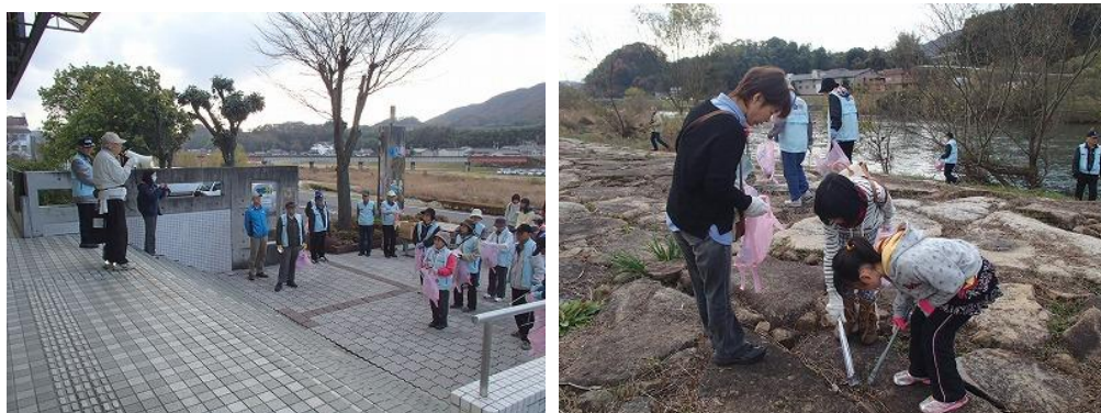
写真 2-2-4 左)水辺クリーンウォーキング(開会式) 右)砂川クリーンクラブ