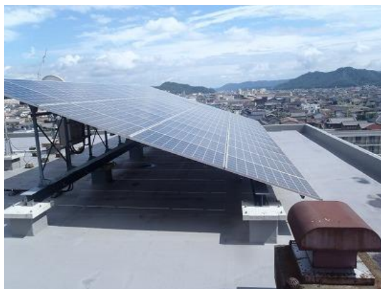
写真 2-2-3 左)ハイブリッド公用車 右)本庁舎屋上の太陽光発電