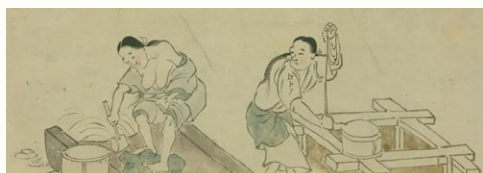
洗濯をする女性たち

『平城京に暮らす 天平びとの泣き笑い』吉川弘文館 2010年、『日本古代木簡論』吉川弘文館 2018年。 近年は、古代の食について三舟隆之氏と共同研究を行っており、共編で『古代の食を再現する みえてきた食事と生活習慣病』吉川弘文館 2021年、『古代寺院の食を再現する 西大寺では何を食べていたのか』吉川弘文館 2023年、『カツオの古代学 和食文化の源流をたどる』吉川弘文館 2024年があります。