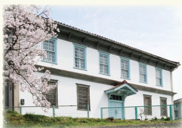
府中市歴史民俗資料館