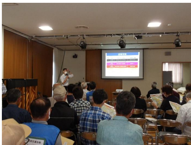
6月のクルトピア栗生での様子