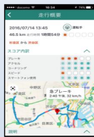
安全運転のヒント