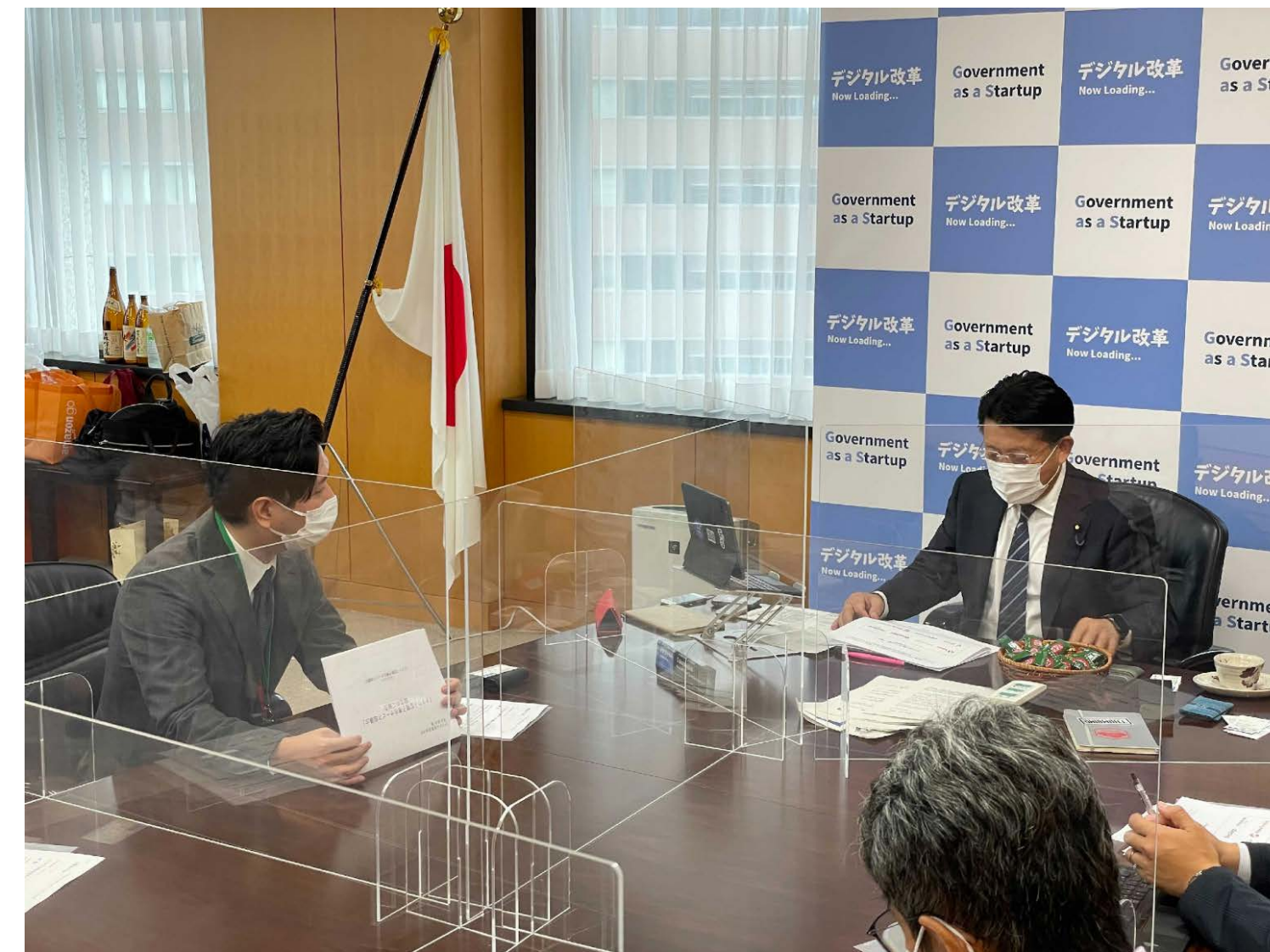
クラウド型電子署名サービス協議会の設立