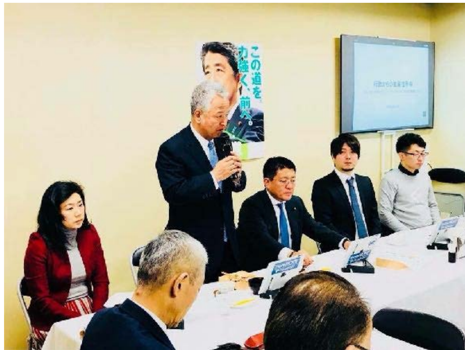
政府へのIT化戦略のご提言

日本の電子契約市場の立ち上がりを支え、政府へのIT化戦略のご提言を始めとし、電子契約の普及とともに、事業を成長させてきました。