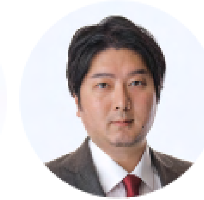
取締役 クラウドサイン事業責任者 弁護士