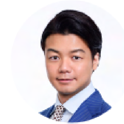
創業者 代表取締役社長 弁護士