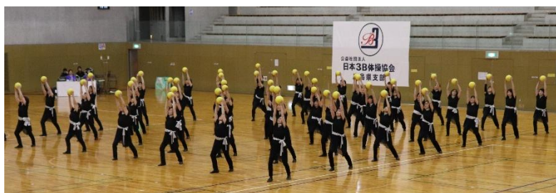
指導者ならではの表現力で、会場の視線を一気に引きつけました

「遊びの要素」「気軽に」「体に無理なく」を大切にしながら、ボール・ベル・ベルターという3つの用具を使い、音楽に合わせて体を動かすことで、筋力アップやリフレッシュ効果が期待できます。楽しく体を動かしながら、心も体も元気になれるのが魅力です。