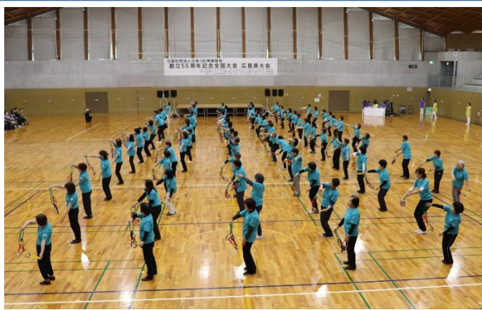
会員が楽しみながら、3B 体操の魅力を表演しました

4月29日（水）、公益社団法人日本3B体操協会創立55周年記念全国大会広島県大会が、TTCアリーナにおいて約500名の参加により開催されました。