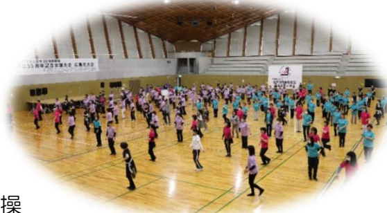
音楽に合わせて会場いっばいに広がる笑顔 最後は参加者全員で楽しくダンス

地域の健康を支える活動として、これからも3B体操の取り組みが広がっていくことが期待されます。