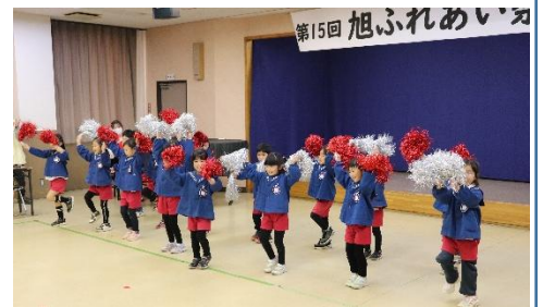
第15回旭公民館祭(令和6年年度) オープニング、たまこども園年長組さん

「こんなことをやってみたい」 「こんな企画なら参加したい」など、 お気軽に公民館までお寄せください。