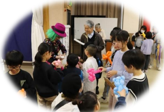
ステージ発表、バルーンショーでの一コマ