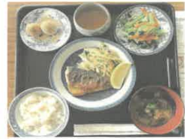
ごはん サバのさらさ焼き もち麦 わさび和え やかましいみそ汁 きなこもち