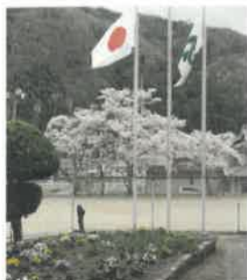
久佐スポーツグラウンド

令和8年(2026年)度のスタートにあたり、公民館長としてごあいさつ申し上げます。人生100年時代と言われる、健康で長生きされる方が増えてきました。自由に使える時間が増えたとも言えます。その時間をどのように活用して、いかに人間らしく有意義な毎日を送っていくかがこれからの課題ではないでしょうか。学ぶことは自己実現や生きがいづくりに繋がります。知りたいことややってみたいことなどの御意見をお寄せいただき、公民館を生涯学習の拠点としてご利用いただければと思います。よろしくお願いいたします。