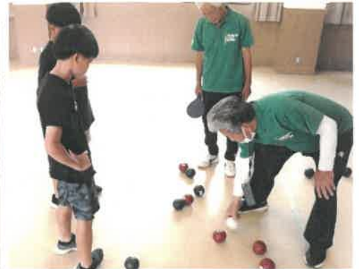
審判が得点を数えています、何点かな～