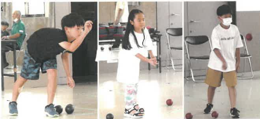
さあ的にめがけてボールを投げるよ