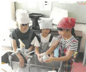
後片付けまでが大事です