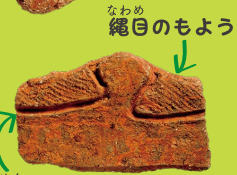
なわめ 縄目のもよう