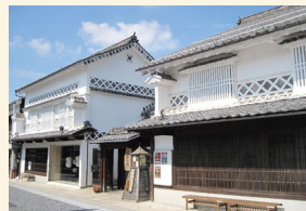
府中市上下歴史文化資料館

所在地 府中市上下町上下1006 開館時間 10時～18時 入館料 無料 駐車場 3台 ほか観光駐車場（徒歩300m） 休館日 祝日を除く月曜日 年末年始 ☎・Fax 0847-62-3999