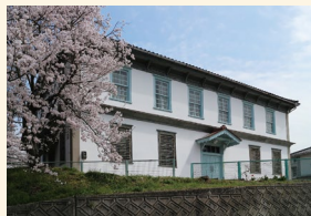
府中市歴史民俗資料館

縄文時代の人々は、まわりの自然や季節の恵みを上手に利用して助け合いながら、12,000年以上もくらしていました。くらしやすいように工夫するなかで土器をつかいはじめ、さらに食べられるものを増やしていったことでしょう。彼らのくらしは、わたしたちが想像している以上に創造的でゆたかだったのかもしれない。