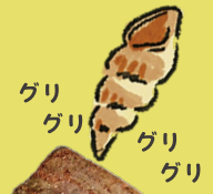
グリ グリ グリ グリ