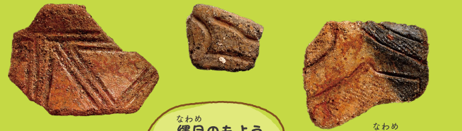
なわめ 縄目のもよう 線のもよう