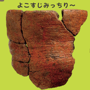
よこすじみっちり~