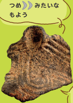
つめ みたいな もよう