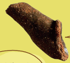
おさけを いれた? やかん?きゆうす? いいえ、 注口土器の そぞぎくちです!