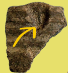
ねんどを はりつけて凹