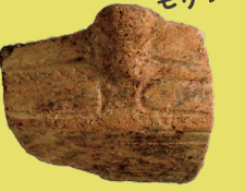
ねんどで モリっと