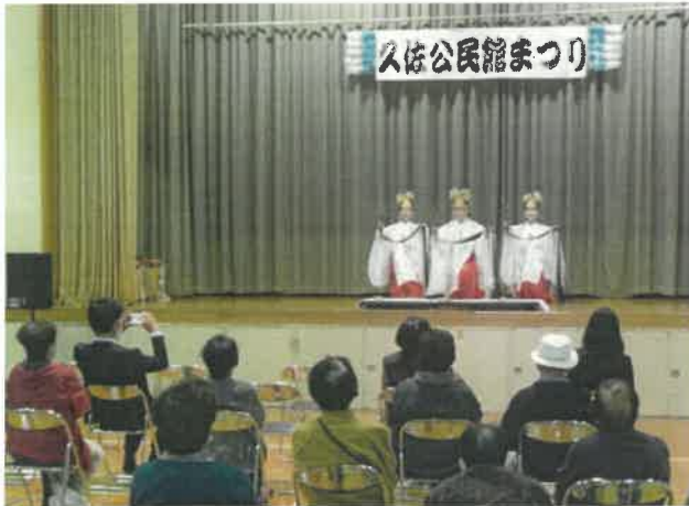
写真は昨年度の巫女舞