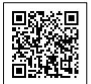
府中市ふるさと納税HPはこちら