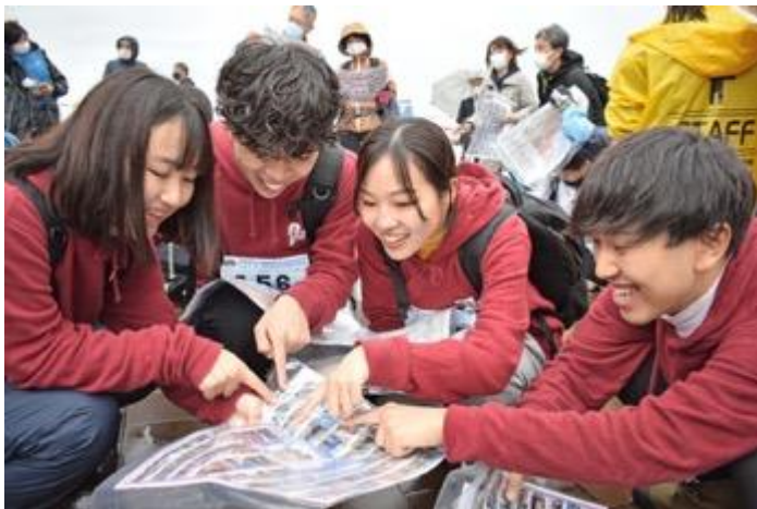
マップを見ながら チームで作戦会議

専用GPSアプリを使ってチームで街巡り。チェックポイントに到着するとスマホが位置情報をキャッチしてポイントをゲット！また、設定された謎解きに正解するとさらにボーナスポイントが加算されます。 仲間や家族とゲーム感覚で楽しみながら地域の魅力を発見できます。