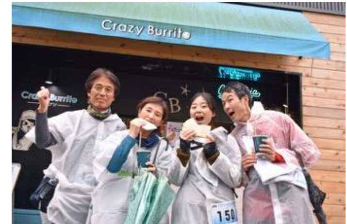
チェックポイントで 食事やお買い物も