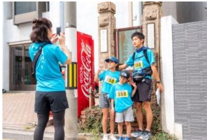
チェックポイントで撮影 &クイズに挑戦