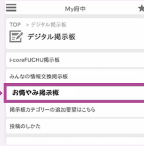
お悔やみ掲示板イメージ