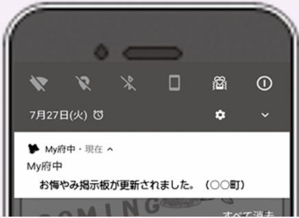
更新情報のプッシュ通知の画面イメージ