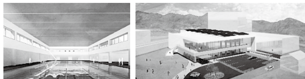
市民プールイメージ