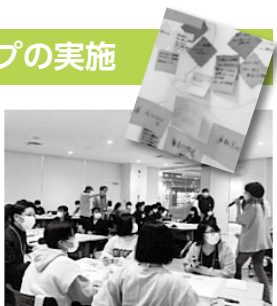
i-coreFUCHUでのワークショップの様子

基本設計段階で、利用者となる市民の皆さんと共に、どんな市民プールにしたいか、広場の使い方など意見を交わしながら進めていきます。