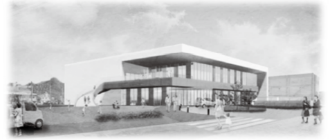
市民プール完成イメージ

上下運動公園人工芝グラウンド、スポーツ&ウェルネス拠点施設としての新しい市民プールの整備を契機として、外部知見との連携を図りながら、地域住民が主体となって、スポーツを活用した賑わいを創出し、その恩恵を市民が享受できる「スポーツのまち府中市」の実現を目指します。