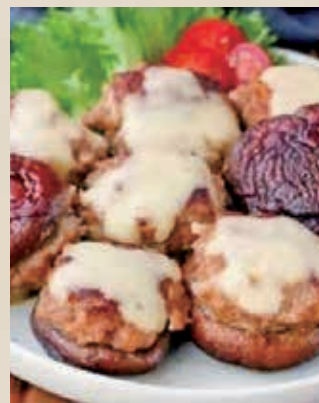
▲府中産椎茸の肉詰め