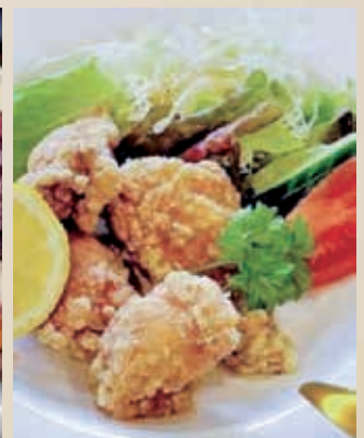
▲中林商店の朝びき鶏

府中産アスパラ、府中産椎茸の肉詰めなど地元の食材を豊富に使ったメニューや、中林商店の朝びき鶏を使用した唐揚げなど、ここでしか味わえない特別なメニューも用意しています。