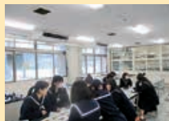
▲カフェスタッフとのミーティング

府中高校食物研究部の生徒とメニュー開発をしています。ミーティングを重ね、府中市産食材を使ったメニューを考案中です。