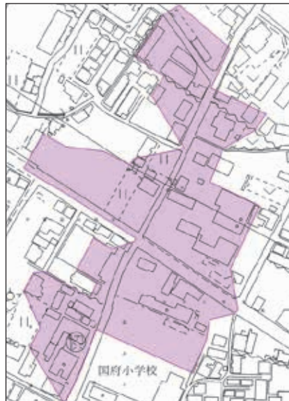
高木町（国府小学校周辺）