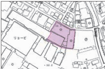
目崎町（リョービ株式会社周辺）