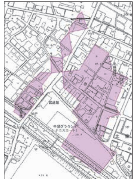
中須町（中須グラウンド周辺）