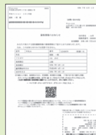
資格情報のお知らせのサンプル