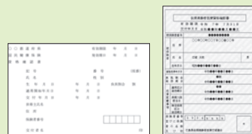
資格確認書のサンプル

※後期高齢者医療保険の加入者で、令和7年7月31日までの期間で保険証の記載に変更がある場合などは、マイナ保険証の有無にかかわらず資格確認書が届きます。