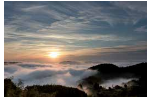
府中市上空、本日晴れ