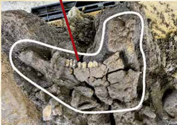
出土したウシの下顎の骨と白歯列