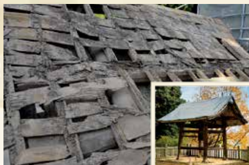
瓦の下の傷み、シートで覆った後(右下)

鐘撞堂は神仏習合時代には多くの神社にありましたが、明治以降その多くが取り壊されました。そのため神社にある仏教的な建物としては、とても珍しいものです。中でも栗柄町に所在する南宮神社の鐘撞堂は、四方吹放ちの形式としては最古級の建築で、市の重要文化財です。