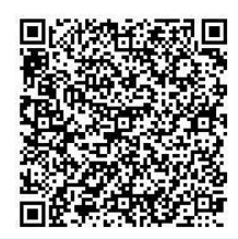
申込フォームQRコード

専用応募フォームによりお申込ください。 https://s-kantan.jp/pref-hiroshima-u/offer/offerList_detail.action?tempSeq=12599