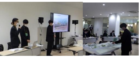
◇最終審査会プレゼンテーション

開催日時 令和5年3月12日(日) 13:30~15:00 (受付開始 13:00)