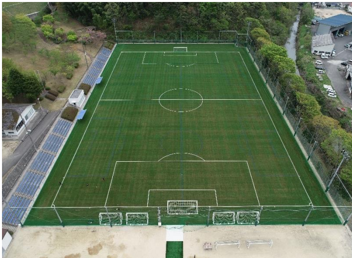
<人工芝グラウンド（第1グラウンド）>

公認ピッチの高品質な環境を県内外に発信し、大会や合宿の誘致などの利用促進につなげることにより、スポーツを通じた地域の賑わいを創出します。