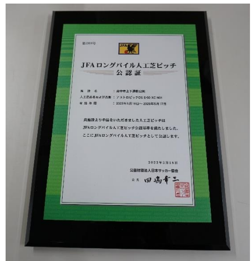
< J F A 公認証 >

公 認 番 号 : 第 2 6 9 号 人工芝品名および品番 : アストロピッチ D S E - 5 0 X C N 0 1 有 効 年 限 : 2 0 2 3 年 5 月 1 8 日 ~ 2 0 2 6 年 5 月 1 7 日