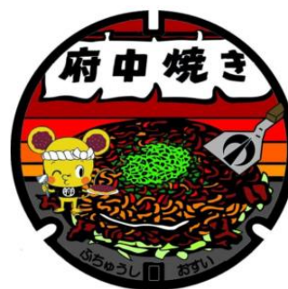
デザインマンホールのイメージ