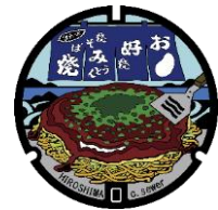
広島市へ寄贈するマンホール

このたび、地元広島への取り組みとして、県内にあるご当地お好み焼にスポットを当て、いま注目を集めているマンホールにご当地お好み焼をデザインしました。制作にあたっては広島県観光連盟様と連携し、参画いただける市町を募ったところ、10市町がご賛同いただき、11個のご当地お好み焼マンホールが完成いたしました。今後、参画いただいた市町に寄贈し、そのマンホールを起点として観光振興に繋げていきたいと考えております。