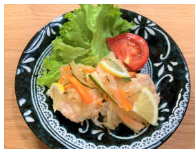
鶏肉の レモン焼き定食 637キロカロリー 食塩相当量:2.9g