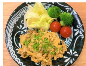
タンドリーポーク定食 515キロカロリー 食塩相当量:2.8g