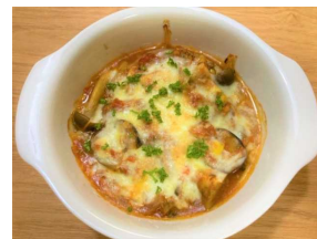
鮭の トマトグラタン定食 682キロカロリー 食塩相当量:2.9g