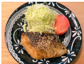
鱈の 甘酢照り焼き定食 630キロカロリー 食塩相当量:2.8g