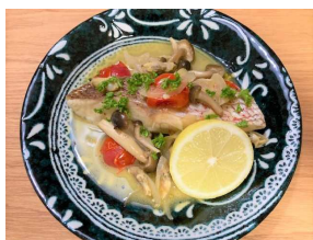
白身魚の アクアパッツァ定食 491キロカロリー 食塩相当量:3.0g