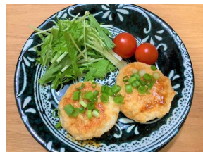
府中味噌 鶏つくね定食 573キロカロリー 食塩相当量:2.9g