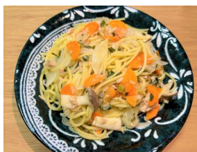
ツナと広島菜の スパゲティ定食 500キロカロリー 食塩相当量:3.0g