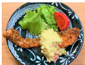
鮭のフライ風 タルタルソース定食 593キロカロリー 食塩相当量:3.0g