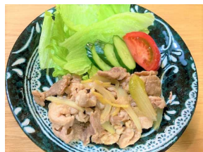
豚肉の しょうが焼き定食 628キロカロリー 食塩相当量:2.5g