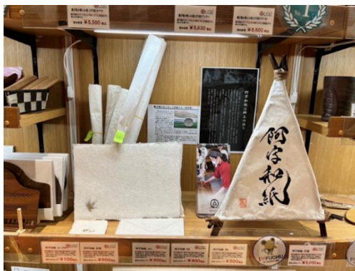
アンテナショップ「NEKI」へ出品