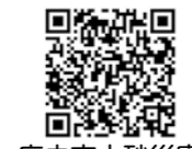
府中市土砂災害ハザードマップ

ハザードマップは、危機管理課で配布しているほか、市のホームページにも掲載しています。