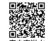
府中市洪水ハザードマップ