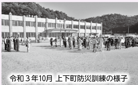
令和3年10月 上下町防災訓練の様子