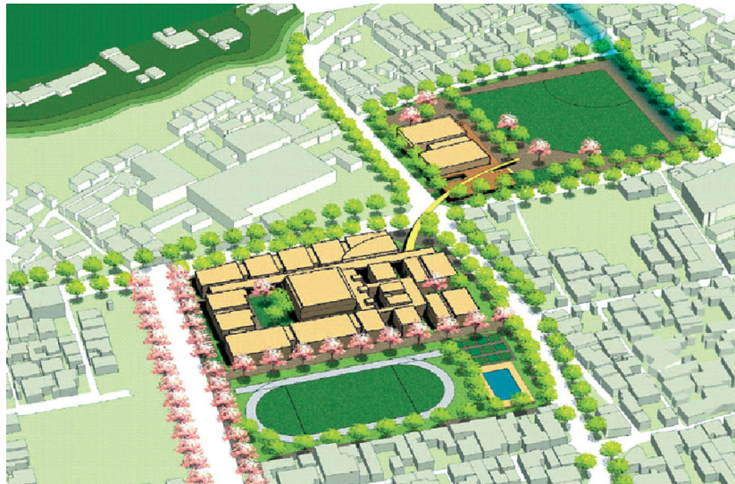
府中市立統合小中学校（仮称）イメージ