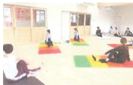
女性応援イベント（ヨガ）のイメージ