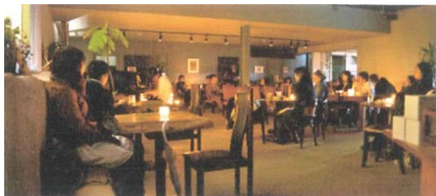
カフェライブのイメージ